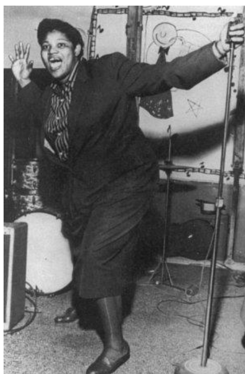
"Little" L.C. Robinson och Big Mama Thornton är båda med på...

..."Let's have a ball!: The music of the juke joints